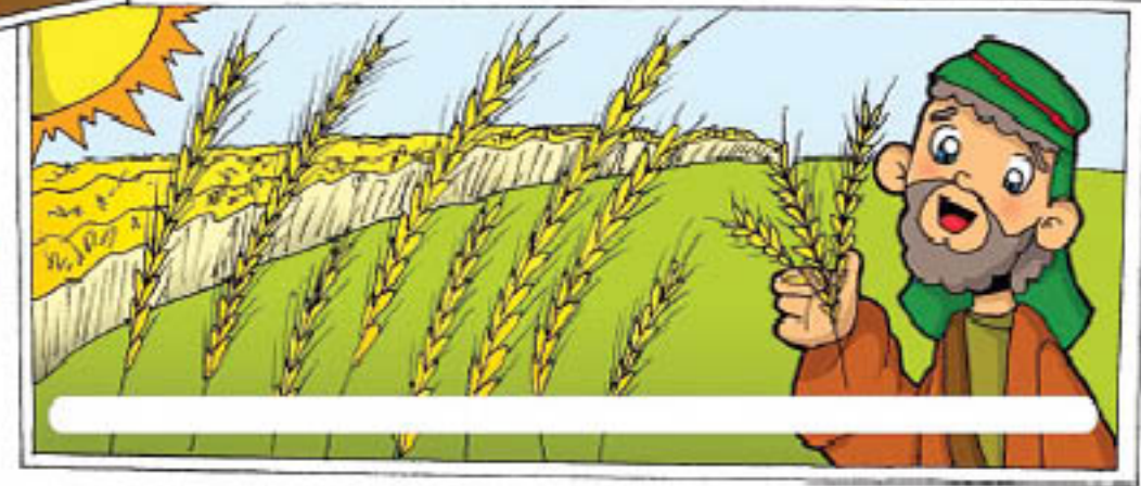
Pero otra parte cayó en tierra buena, y creció, y dio una buena cosecha, hasta de cien granos por semilla.